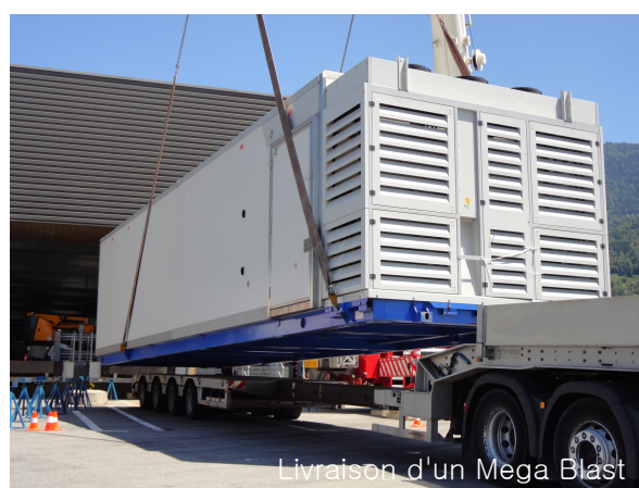
Livraison d'un Mega Blast