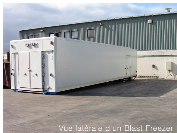
Vue latérale d'un Blast Freezer