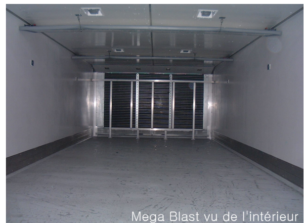
Mega Blast vu de l'intérieur