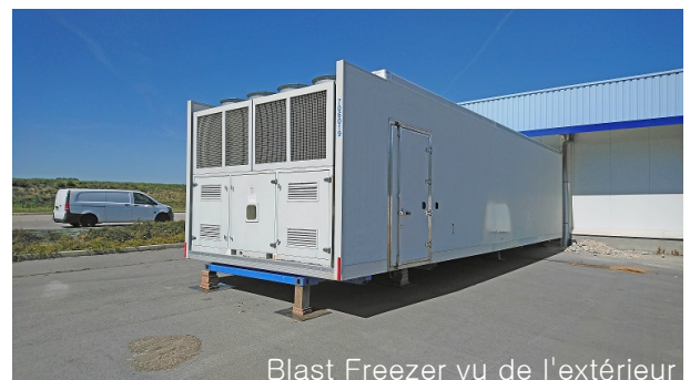
Blast Freezer vu de l'extérieur

Système de monitoring et d'enregistrement du fonctionnement du module